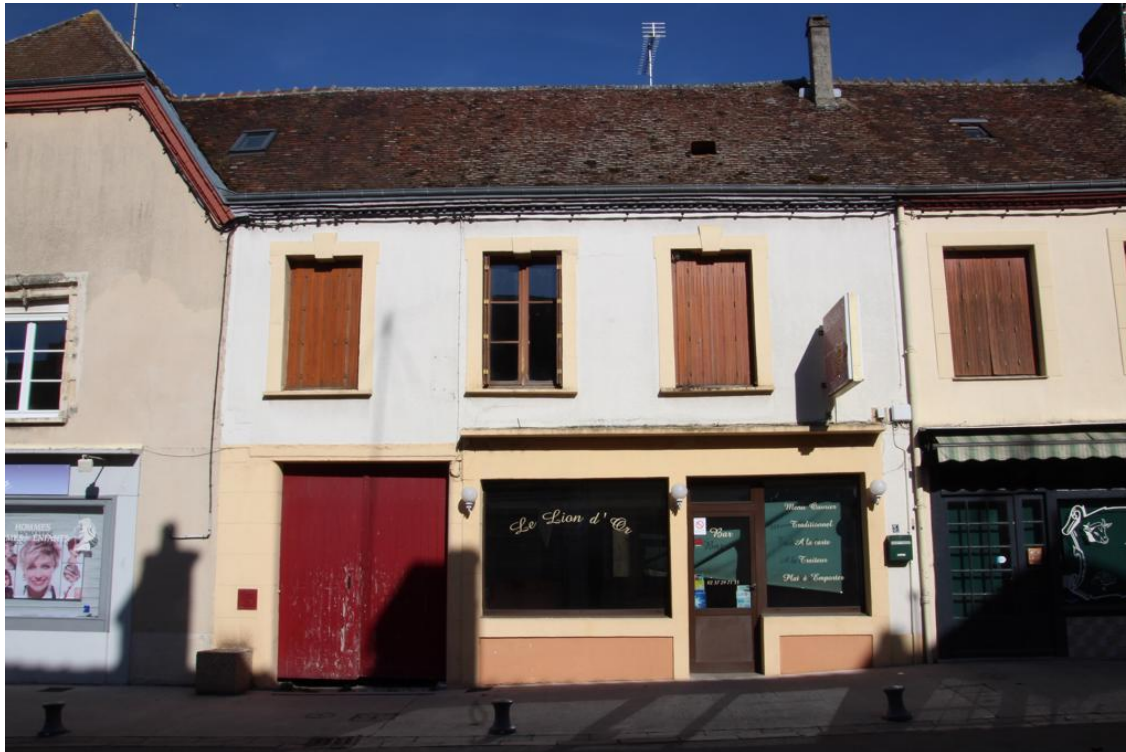
Le Lion d'Or : une rénovation s'impose